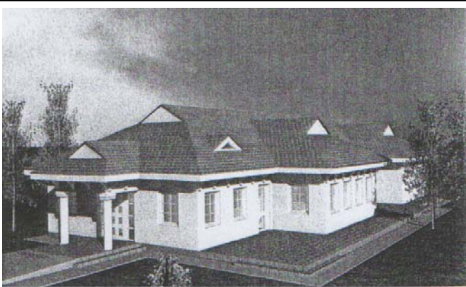
Az idősek Napközi Otthona épületének látványterve.