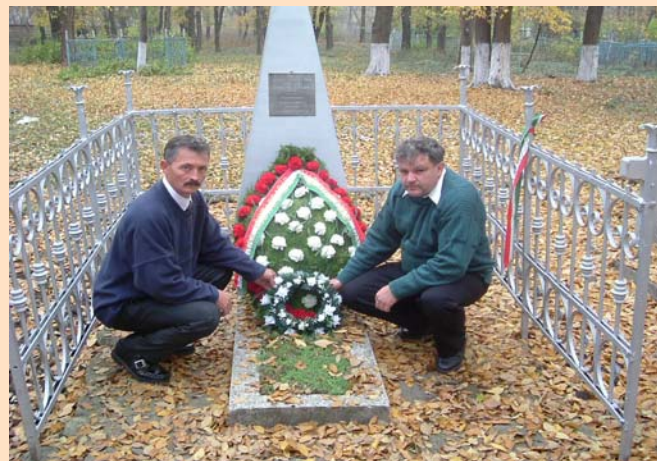
Képviselőink koszorúzása a Balti-ban lévő emlékműnél – 2004. november

Emléküket a község központjában és a moldáviai Baltiban felállított emlékmű őrzi.