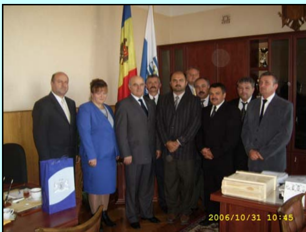
2006. őszén újra látogatást tettek a Képviselő-testület tagjai a moldáv BALTI városában, megkoszorúzza a háborús hőseink emlékművét. A delegációt fogadta Balti polgármestere.