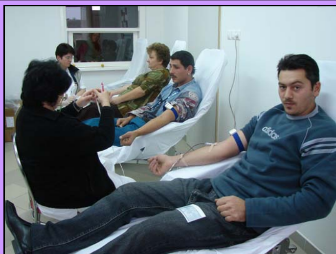
Véradás az INO-ban