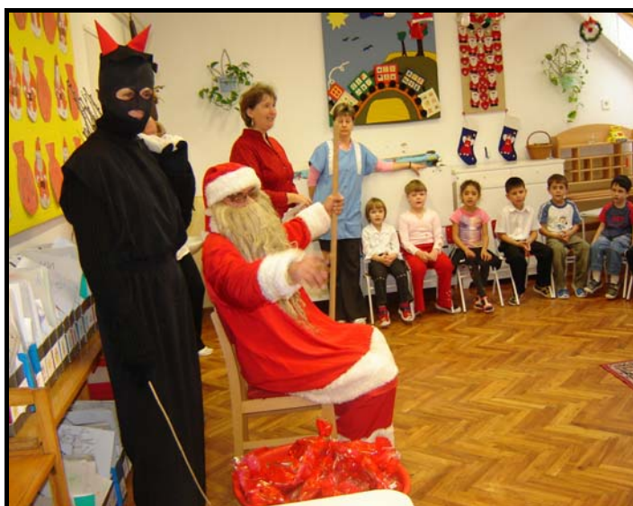
Újra eljött a Mikulás az óvodába

2007. februárjától, aki az Interneten a www.encsencs.hu címen található honlapra kattint új arculattal találja szembe magát. A könnyen kezelhető menüpontok a település története, az önkormányzat és intézmények, a civil és egyéb szervezetek bemutatása és működése mellett aktuális információkat, helyi híreket, falusi eseményeket is tartalmaznak. A honlap frissítéséhez szükséges információk összegyűjtését az ifjúsági egyesület tagjai vállalták.