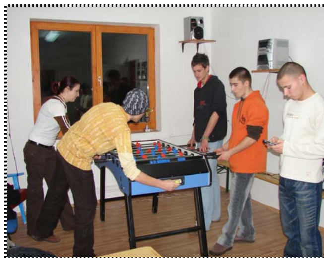
Ujra indulhat a kedvenc CSO-CSO-zás