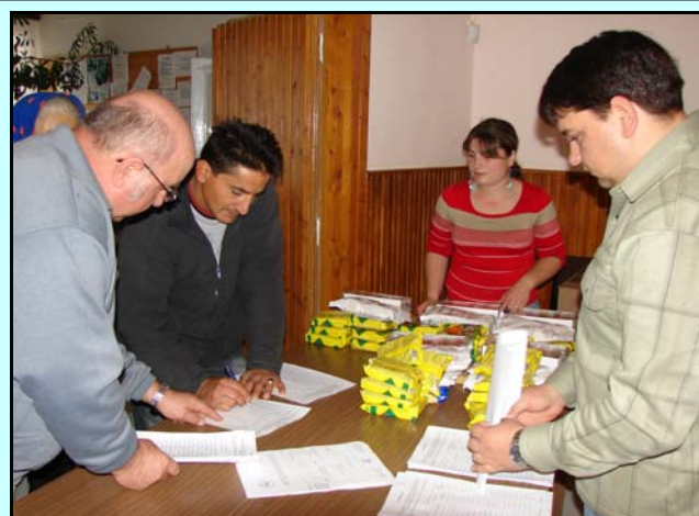
Élelmiszer csomagok osztása a polgármesteri hivatalban