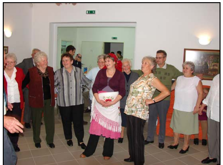
Jókedvű, vidám a hangulat az idősek Erzsébet-napi zenés mulatságán