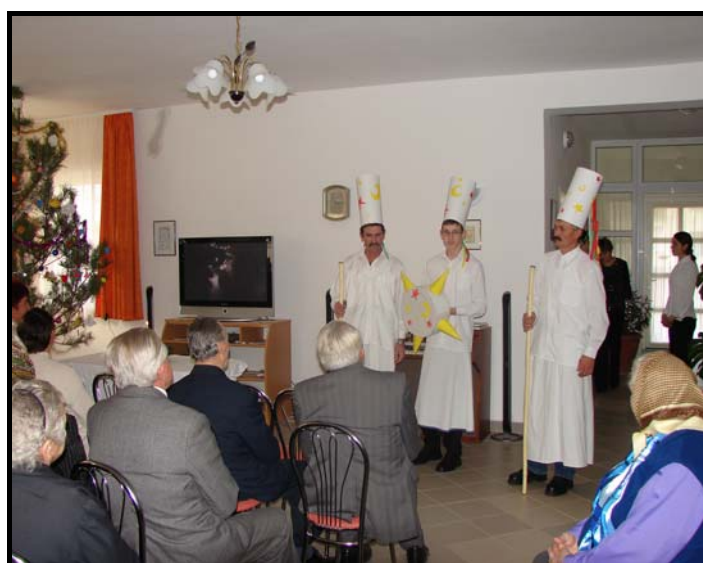
Csillagosok idézték fel a régi népi játékokat az öregotthonban