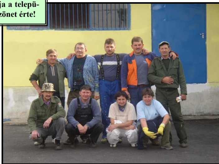
Az önkéntes „felújító és festőbrigád” csapata