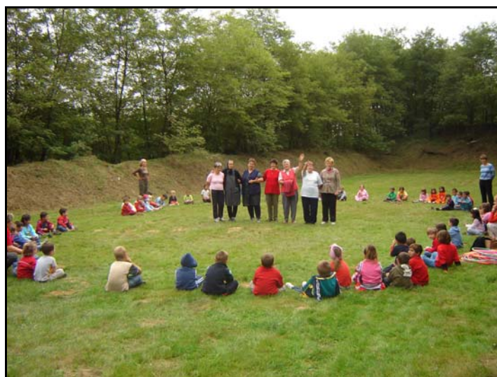
Az őszi folyamán az idősekkel töltötték a közösségi programok nagy részét az ovisok