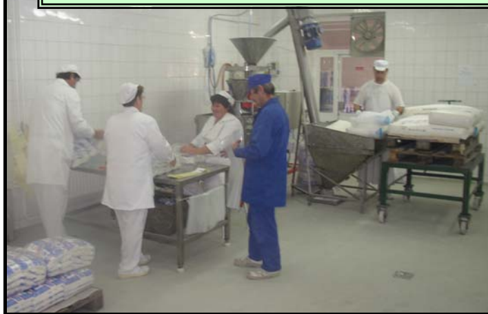
Az üzemben munka közben

A Pro-Rehab Kft. működése óta rendszeresen támogatja a település intézményeit az általuk csomagolt termékekkel. Köszönet érte!