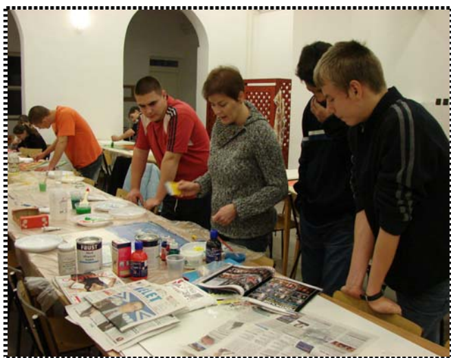
„Művészkednek” a fiatalok, készül az új klub belső dekorációja